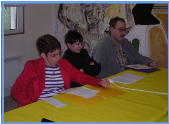
Assemblée générale - Mars 2012.