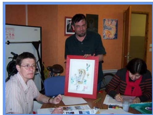
Atelier peinture - Mars 2012.