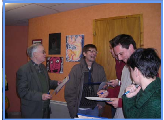
Epiphanie - Janvier 2012.