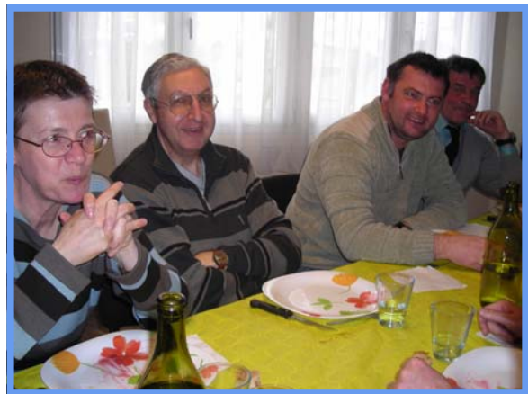
Choucroute - Mars 2012.