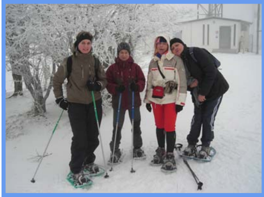
Sortie raquettes - Janvier 2012.