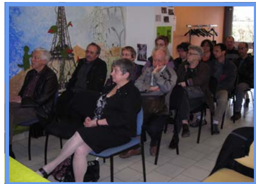
Assemblée générale - Mars 2012.