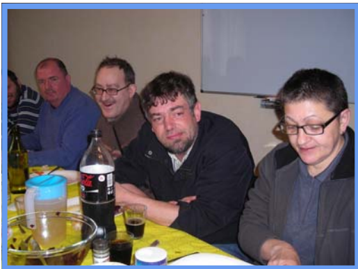
Choucroute - Mars 2012.