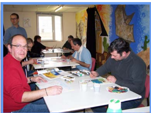
Atelier peinture - Mars 2012.