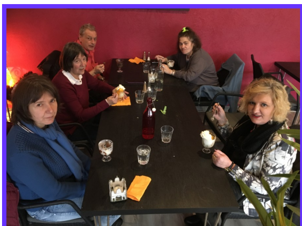
Repas de Noël - Valdahon - Décembre 2019