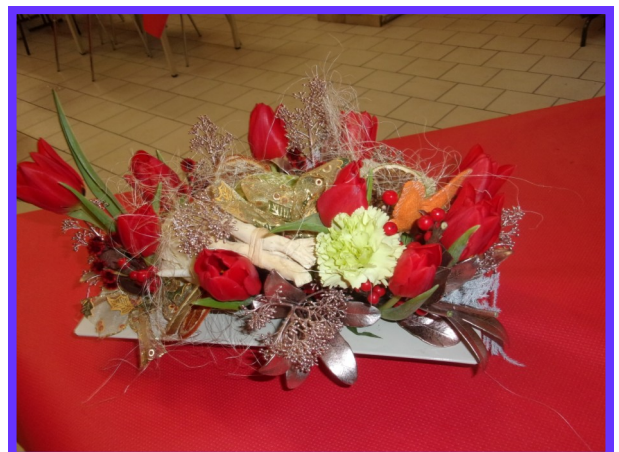
Compositin florale pour Noël—Décembre 2019