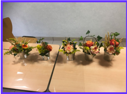
Atelier art floral - Octobre 2019 Animé par Peggy, une Floréaliennne.